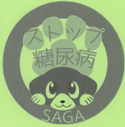
佐賀県糖尿病対策キャラクター「ナナ」